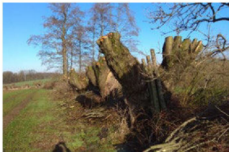
Hlavaté vrby po ořezu v zimě 2018, potoky v Bernarticích nad Odrou.

Letos plánujeme ořezy vrb také v Košatce nad Odrou. Rádi bychom si o tom s vámi povídali na společném setkání. Můžete nám i napsat.